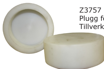
Z3757 Plugg för Billman-koppling. Tillverkad i high-tech polymer.