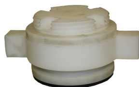
Z3763 Bajonettplugg i high-tech polymer. Speciellt verktyg krävs för att öppna.

Detta är en produkt som i takt med ökade krav och risker i samhället säljer mer och mer!