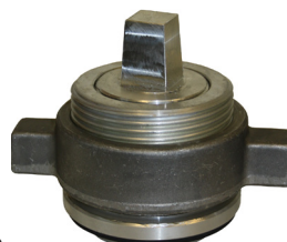
Z3767 Låsbar plugg bajonett i aluminium.