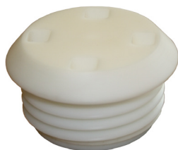
Z3764 A-plugg tillverkad i high-tech polymer. Speciellt verktyg krävs för att öppna.