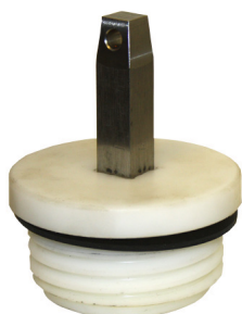
Z3765 Plugg i komposit A-plugg med tapp tillverkad i high-tech polymer.