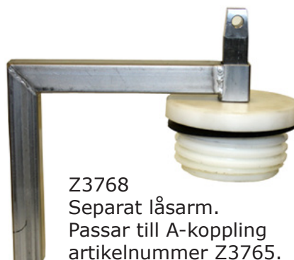
Z3768 Separat låsarm. Passar till A-koppling artikelnummer Z3765.